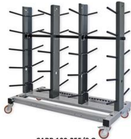
CARR 100-255/8 Q